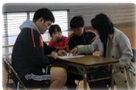
データ結果分析・説明